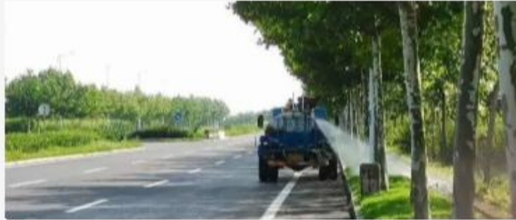
区交通运输局：精细化管理促公路环境提升