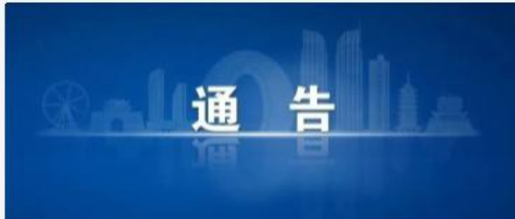
10月19日起，这些路段将临时封闭